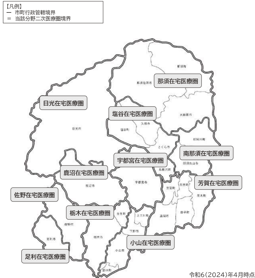
各医療圏と市町の関係