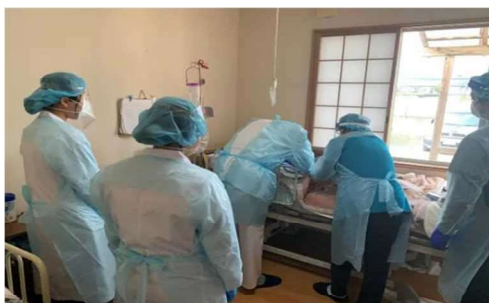
地域医療ガイダンス