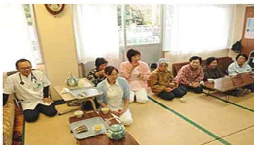
へき地における巡回診療